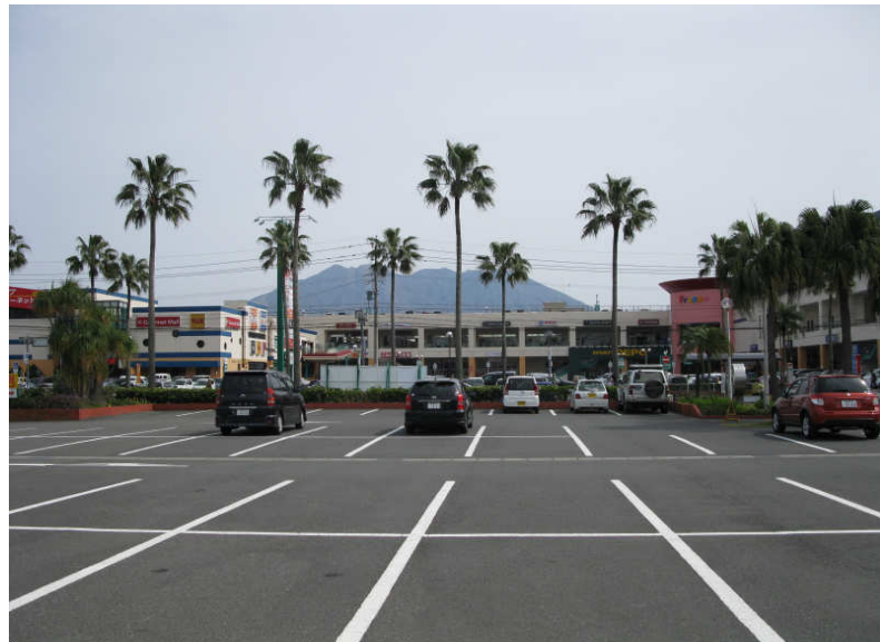
⑨近隣の商業施設「フレスポ・ジャングルパーク」