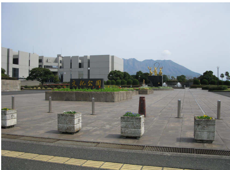
①隣接の鹿児島市民文化ホール

鹿児島市のウォーターフロント与次郎地区は、鹿児島市が昭和45年に海を埋め立てて造成した観光地区です。 近隣には、市民文化ホール、県営陸上競技場、テニスコート、ホテル、ショッピングセンターなどが立ち並ぶ素晴らしい場所です。 また与次郎2丁目はマンション建設も可能な地域です。