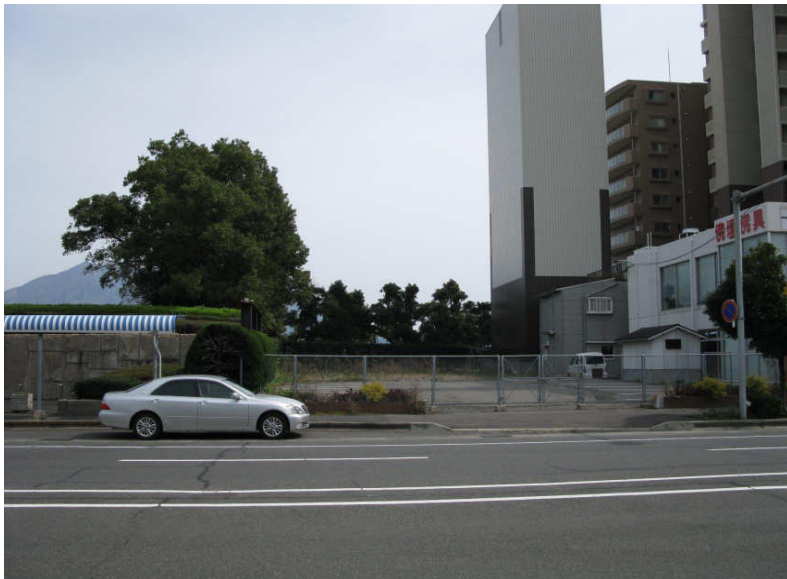
③売却予定地（左が文化市民ホール）