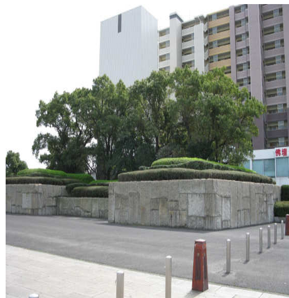
②隣接の鹿児島市民文化ホール