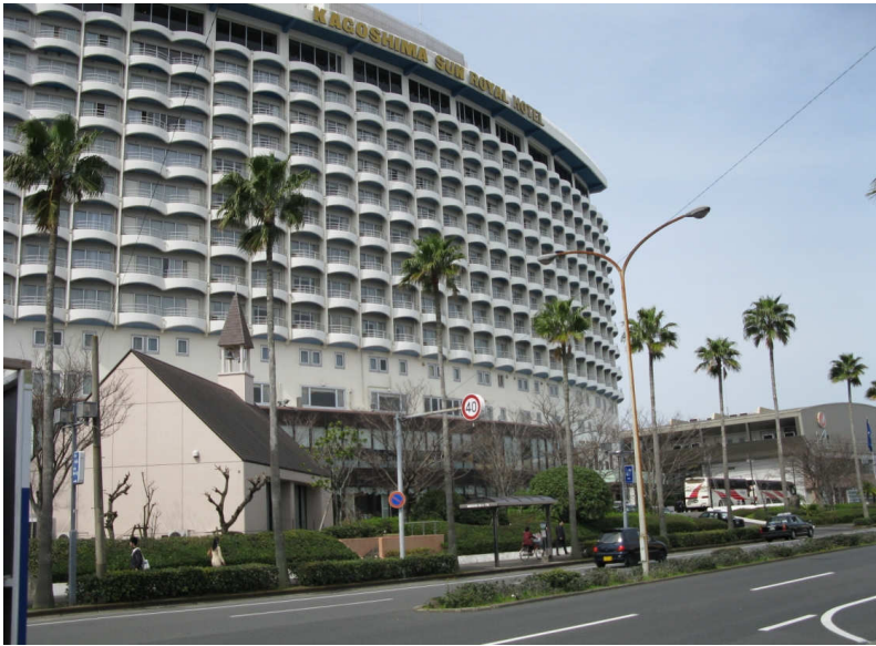
⑦近隣の商業施設「サンロイヤルホテル」