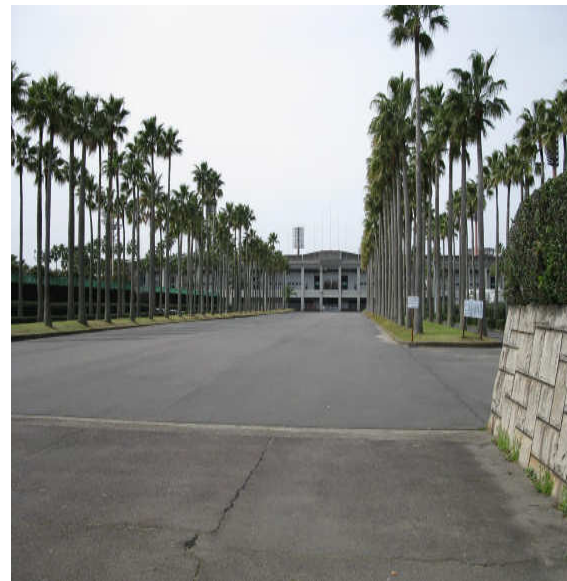
⑥敷地前の県立陸上競技場