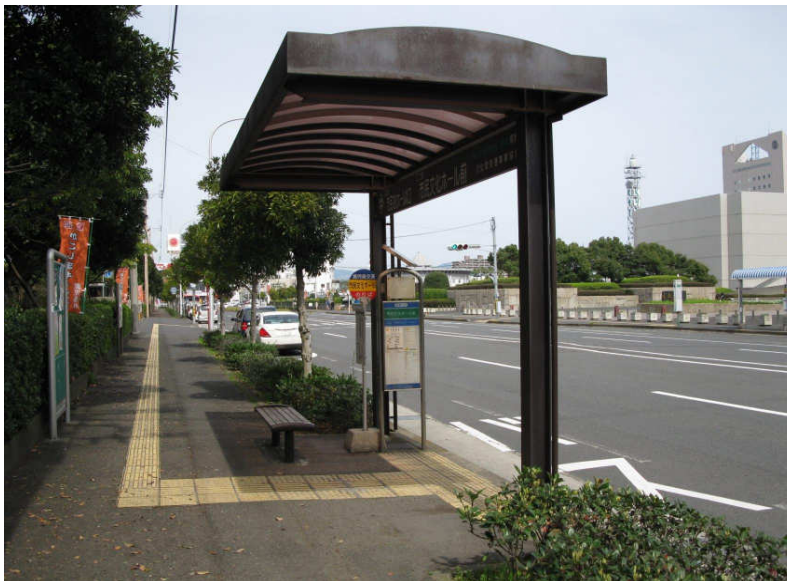
⑤敷地前のバス停「市民文化ホール前」