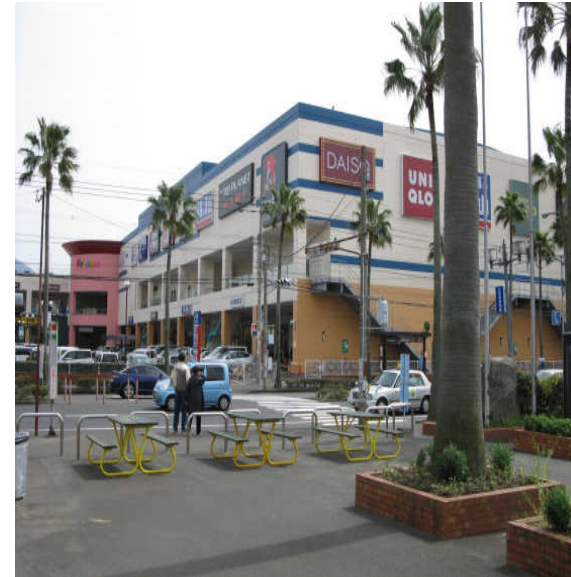
⑩近隣の商業施設「フレスポ・ジャングルパーク」